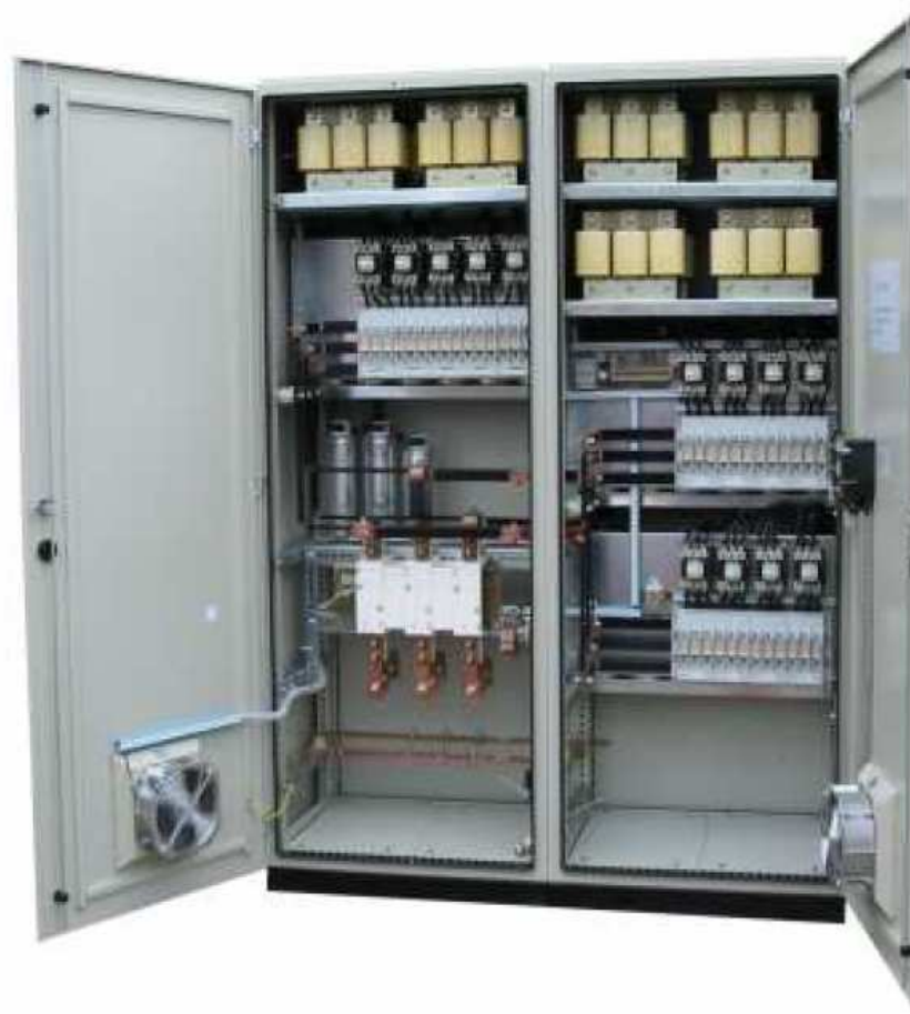
Foto 1. Automatycznie regulowana bateria niskich napięć KMD720R 400V z dławikami (filtry odstrojone) f_r = 189\text{Hz} . Produkcja firmy ELMA energia. Eksport do Holandii.